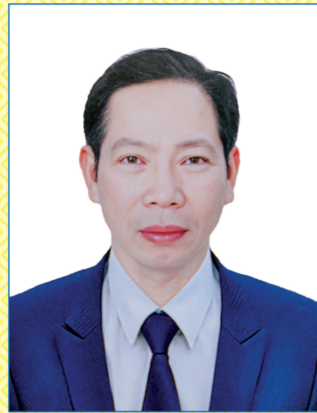
Ông VŨ TIẾN PHỤNG

Từ tháng 10/2025 đến nay: Ủy viên Ban Thường vụ Thành ủy, Ủy viên Ban Thường vụ Đảng ủy Ủy ban nhân dân thành phố, Ủy viên Ủy ban nhân dân thành phố, Phó Chủ tịch Ủy ban nhân dân thành phố Hải Phòng (kiêm Giám đốc Sở Nội vụ từ tháng 10/2025 đến tháng 11/2025); đại biểu Hội đồng nhân dân thành phố Hải Phòng khóa XVII, nhiệm kỳ 2021 - 2026.