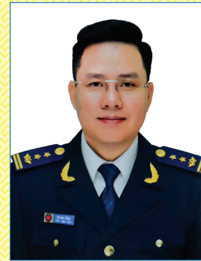
Ông VŨ ANH TUẤN

Từ tháng 01/2016 - tháng 8/2020: Ủy viên Ban Chấp hành Đảng bộ tỉnh Hải Dương, Phó Bí thư Thường trực Huyện ủy Gia Lộc; Chủ tịch Hội đồng nhân dân huyện Gia Lộc, tỉnh Hải Dương (từ tháng 5/2016); Bí thư Huyện ủy Gia Lộc (từ tháng 8/2018). Từ tháng 9/2020 - tháng 6/2025: Ủy viên Ban Chấp hành Đảng bộ tỉnh Hải Dương, Trưởng ban Pháp chế Hội đồng nhân dân tỉnh; Phó Chủ tịch Hội đồng nhân dân tỉnh Hải Dương (từ tháng 3/2021). Từ tháng 7/2025 đến nay: Ủy viên Ban Chấp hành Đảng bộ thành phố, Phó Chủ tịch Hội đồng nhân dân thành phố Hải Phòng khóa XVI, nhiệm kỳ 2021 - 2026.