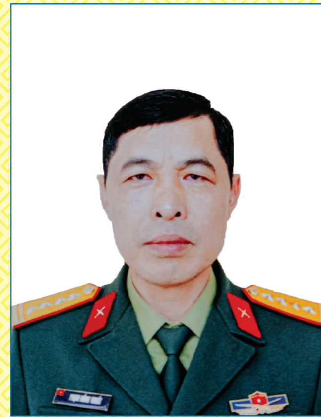
Ông PHẠM HỒNG THUẬT

Từ tháng 10/2025 đến nay: Ủy viên Ban Thường vụ Thành ủy, Ủy viên Ban Thường vụ Đảng ủy Ủy ban nhân dân thành phố, Ủy viên Ủy ban nhân dân thành phố, Phó Chủ tịch Ủy ban nhân dân thành phố Hải Phòng (kiêm Giám đốc Sở Nội vụ từ tháng 10/2025 đến tháng 11/2025); đại biểu Hội đồng nhân dân thành phố Hải Phòng khóa XVII, nhiệm kỳ 2021 - 2026.