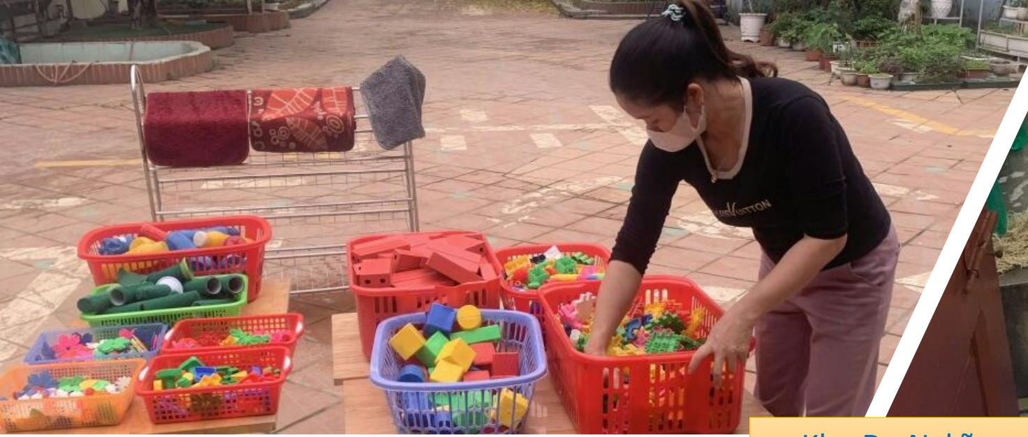
Khu Dụ Nghĩa