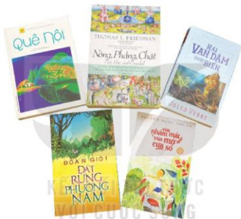
Một số cuốn sách phù hợp với các chủ đề và thể loại em đã học ở lớp 7