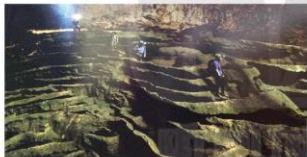
Sơn Đoòng lần đầu được giới thiệu vào năm 2009 từ sự phát hiện của Hồ Khanh, ảnh tư liệu

Từ giữa cuộc sống son trắng với những chuyến đi rừng, Hồ Khanh lại tắt bật với chuyện “com, áo, gạo, tiền”. Chuyện cái hang có luồng gió mát lạ ấy và nhiều hang đá khác coi như tạm quên. Song vì là người đi nhiều, biết nhiều, thông thuộc địa hình nên Hồ Khanh luôn được người dân trong làng giới thiệu với những nhà khoa học đến đây để tìm hiểu, nghiên cứu hang động. Và rồi Hồ Khanh trở thành cái tên quen thuộc gắn liền với những “chiến tích” khám phá hang động của các nhà nghiên cứu khoa học.