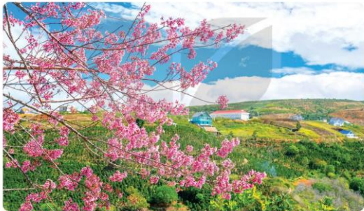
Hoa anh đào Đà Lạt

Với nhiều người, đó là thứ xa xỉ viễn mơ (1) . Bản thân cái bản tin đó cũng có thể tạo cảm giác lạc lõng ngay trên trang báo, giữa cái thời ai cũng mong chờ báo chí đem lại cái thiết thân (2) , cái giết gân, cái chạm vào toan tính mưu sinh thường nhật (3) . Những độc giả bị “sốc hoa (4) ” này sẽ hỏi ngay, một bản tin hoa nở, hoa tàn thì liệu có giải quyết được điều gì [...]?