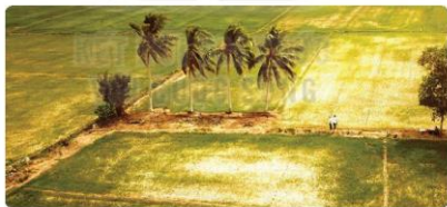
Hạn mặn khốc liệt ở Đồng bằng sông Cửu Long đầu năm 2020, ảnh của Quốc Trung, báo điện tử Đại đoàn kết, ngày 24/02/2020

Tại sao có thể cho rằng người ta đã nhầm lẫn khi dùng thuật ngữ “sự nóng lên của Trái Đất”?