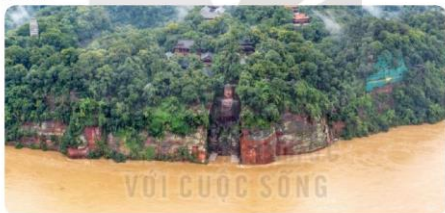
Lũ lớn (tháng 8/2020) ở thượng nguồn sông Trường Giang (Trung Quốc) dâng nước đến chân tường Phật khổng lồ 1 200 tuổi. Nguồn: Trại-no Niu (China News) (báo điện tử Thế giới và Việt Nam đăng lại ngày 21/8/2020)

Hãy quen với điều đó. Thời tiết có thể sẽ như trong truyền khoa học viễn tưởng, nhưng bản chất khoa học của nó là hoàn toàn có thật. Nhiệt độ trung bình chỉ cần tăng lên một chút là thời tiết đã thay đổi rất nhiều, vì chênh lệch nhiệt độ làm hình thành cũng như tạo ra hướng vận động của gió trên bề mặt Trái Đất. Do đó, khi bạn làm thay đổi nhiệt độ trên bề mặt Trái Đất, bạn cũng làm thay đổi hướng gió – và cả tình hình gió mùa trước khi bạn nhận biết được điều đó nữa. Khi Trái Đất nóng hơn, tốc độ bay hơi nước cũng thay đổi – đó là lí do chủ yếu làm xuất hiện những trận mưa bão rất lớn ở nơi này và những đợt nóng khắc nghiệt hơn, hạn hán kéo dài hơn ở nơi khác.