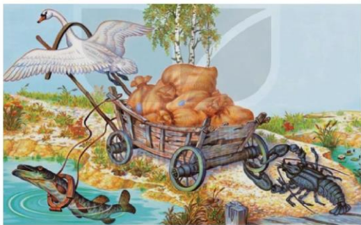
Thiên nga, cá mãng và tôm lù, tranh của Vla-đi-mi-a A-bê-cốp (Vladimir Arbekov)

Vì sao vậy? Hãy tìm nguyên cớ Hoà ra tôm chỉ cố giặt lù, Thiên nga kéo bồng lên trời, Cá mãng thì cố sức bơi xa bờ. Đến nay xe vẫn nằm trơ... Nếu ai có hỏi, xin nhờ ngư ngôn Cho hay dù việc còn con, Mà không nhất trí thì còn hồng to. Thuận chồng, thuận vợ, hát hò Biển Đông cũng cạn (1) , chẳng lo lắng gì.