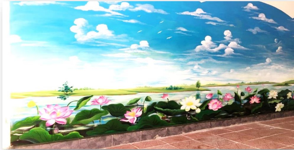
Bức tranh ở lối ra vào nhà xe

Với tổng chiều dài gần 500 m (gần 600 m 2 ) tường được trang trí theo các chủ đề vô cùng phong phú : “Em yêu quê hương”, “Thiên nhiên tươi đẹp”, “Đại dương xanh”, “Em bảo vệ môi trường”, “Cùng em bay vào tương lai”, các dãy cầu thang lớp học lại mang những nét đẹp, sự thú vị, yêu thích riêng với các bạn học sinh bởi màu sắc sinh động và những hình vẽ gần gũi mang tính giáo dục cao.