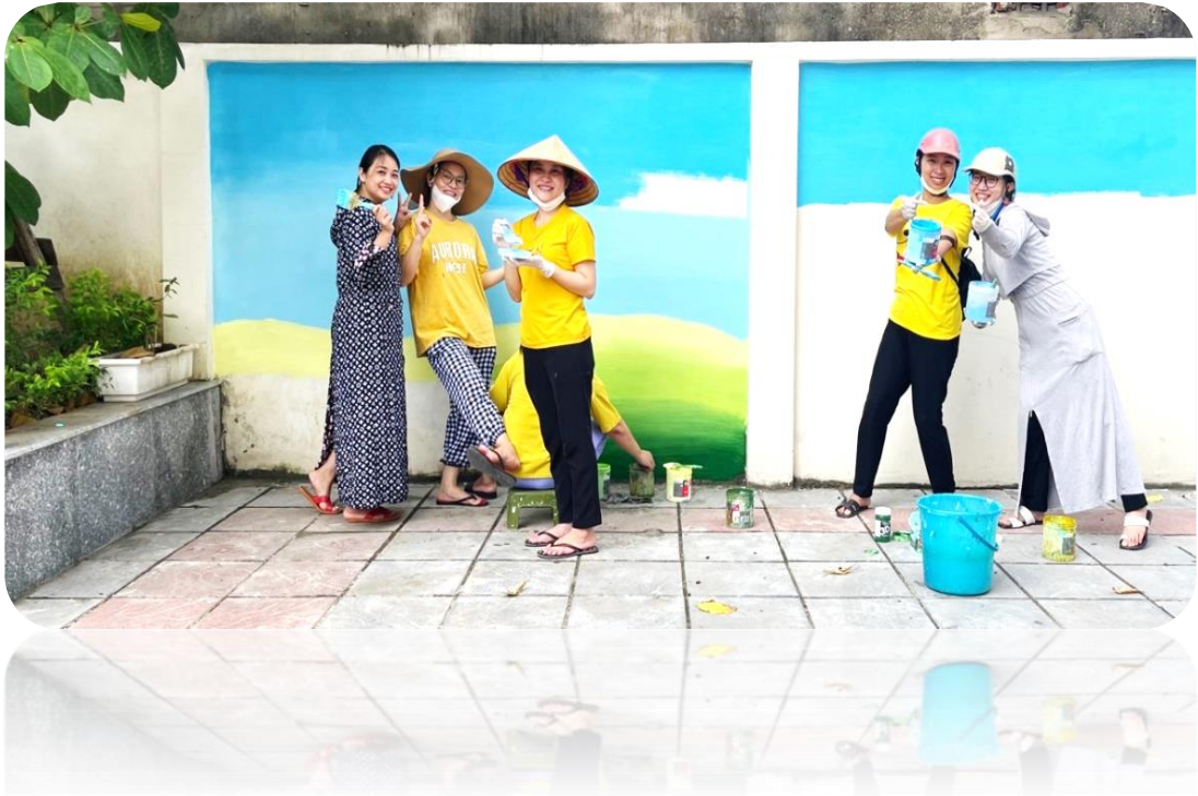
Những nụ cười rạng rỡ trong lao động