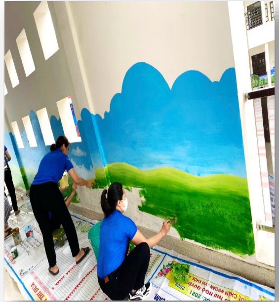
Đề lúc tranh tại các khu vực hành lang