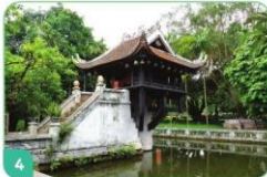
4 Chùa Một Cột