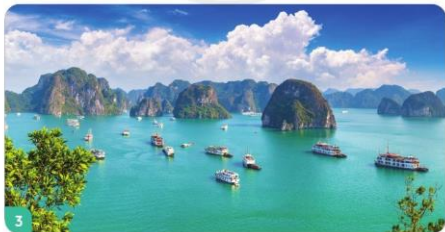
3 Vịnh Hạ Long