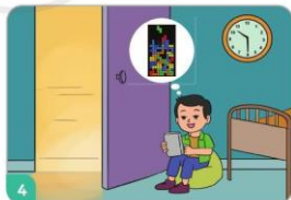
4 Ham chơi điện tử.