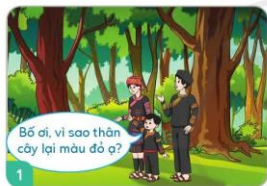
1 Thích khám phá điều mới lạ.