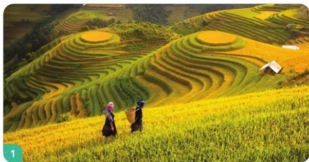
1 Ruộng bậc thang Sa Pa