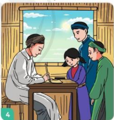
4 Mấy năm sau, mọi người đều kính trọng ông vì văn hay chữ tốt.

(Theo Bảo Linh, Chuyện kể về tấm gương Đạo đức , NXB Hồng Đức, 2019)