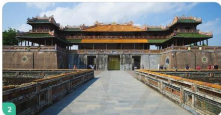
2 Đại nội Kinh thành Huế