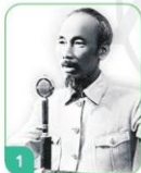
1 Chủ tịch Hồ Chí Minh

Quan sát tranh và chọn những hình ảnh về đất nước, con người Việt Nam