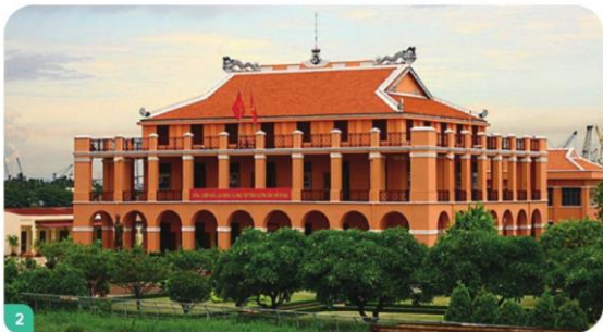
Bến Nhà Rồng