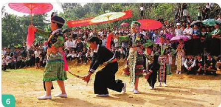
Tinh thần vượt khó, cần cù lao động