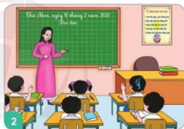
2 Tích cực phát biểu.