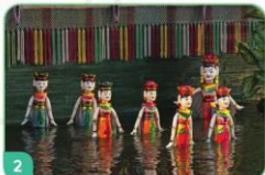
2 Múa rối nước