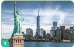
3 Tượng Nữ thần tự do