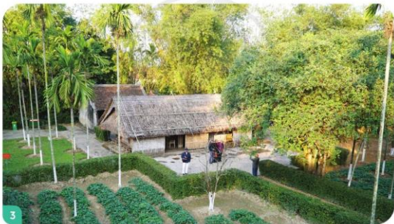
Làng Sen quê Bác

4. Em hãy thực hiện tư thế nghiêm trang khi chào cờ theo hướng dẫn sau: