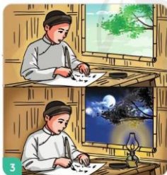
3 Cao Bá Quát quyết tâm luyện chữ.