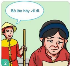
2 Lá đơn viết li lẽ rõ ràng, nhưng quan không đọc được vì chữ quá xấu.