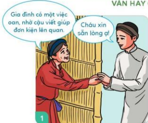
1 Cao Bá Quát là người nổi tiếng văn hay.