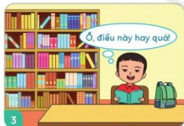
3 Chăm đọc sách.