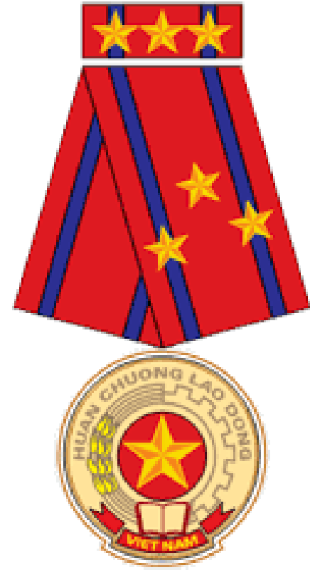
Huân chương Lao động