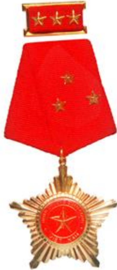
Huân chương Quân công