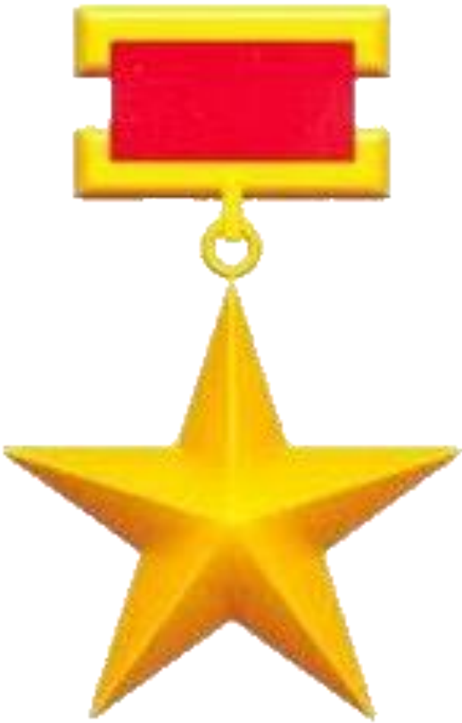
Huân chương Sao vàng